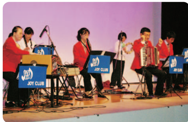
JOY倶楽部ミュージックアンサンブル

元NHK報道ディレクター。自死遺児たちの取材をきっかけに、自殺対策の重要性を認識。2004年にNHKを退職し、ライフリンクを設立。10万人署名運動等を通して2006年の「自殺対策基本法」成立に大きく貢献する。自殺対策の「つなぎ役」として日々全国を奔走中。鳩山・菅政権においては、内閣府参与（自殺対策担当）を務めた。